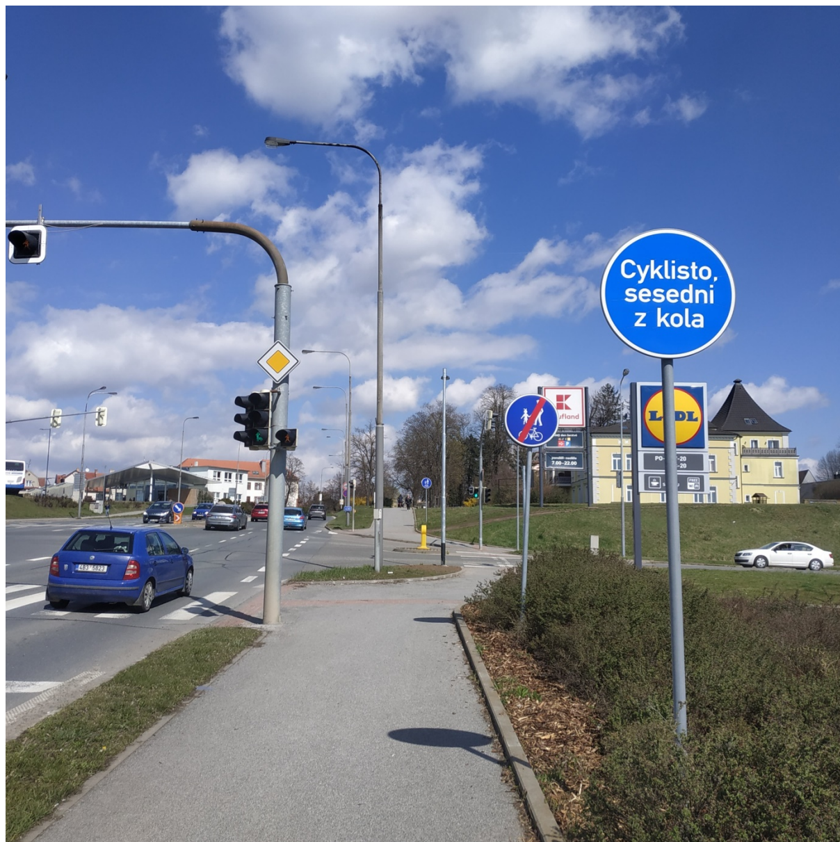
Obr. Brněnská – OC Kaufland/Lidl